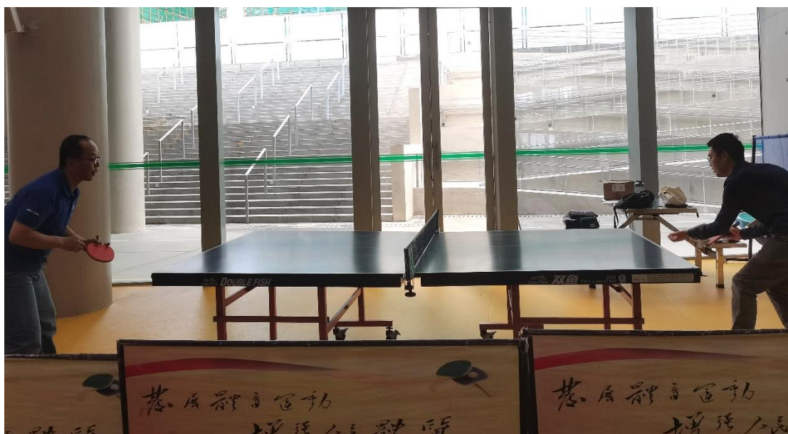
两位老师正在切磋