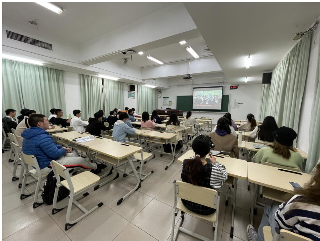
集体观看《我向“两会”说愿望》视频